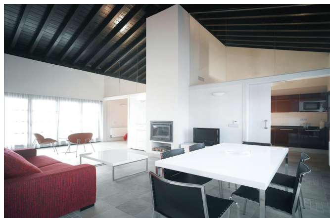
Stora rymliga villor fullt utrustade med moderna kök